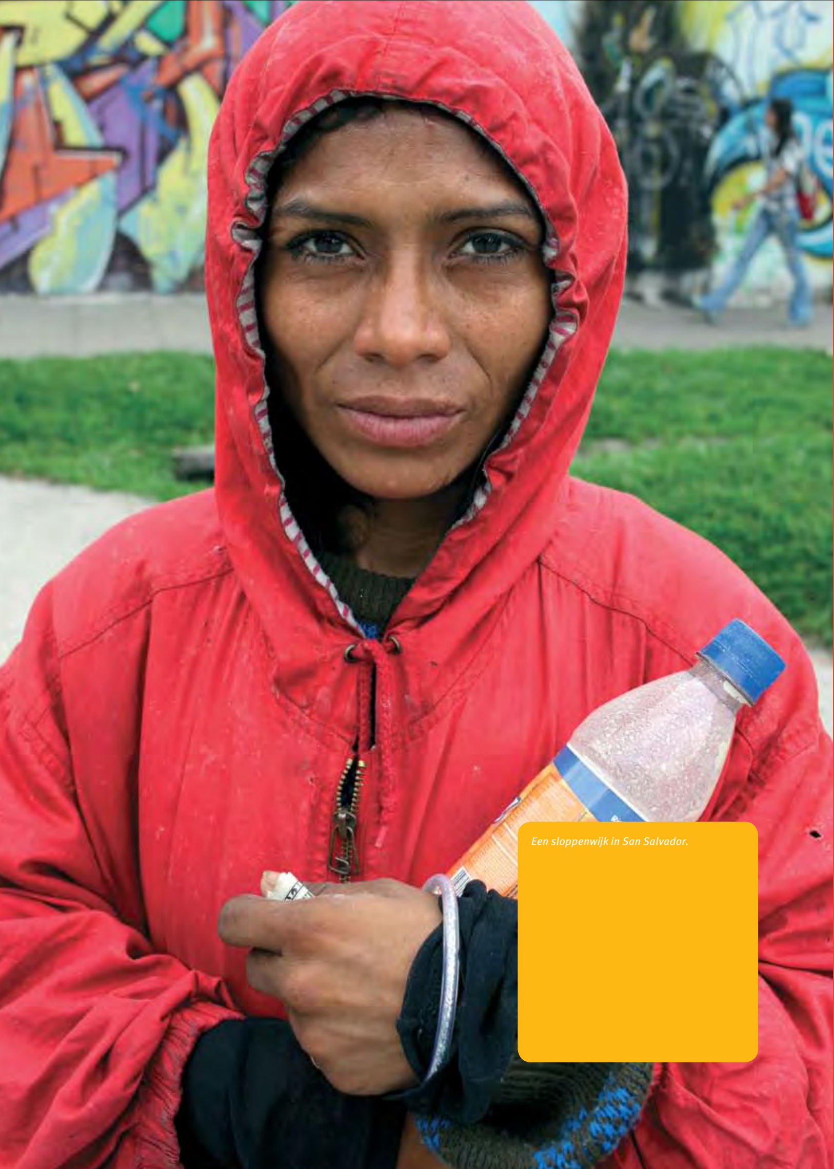
Een sloppenwijk in San Salvador.