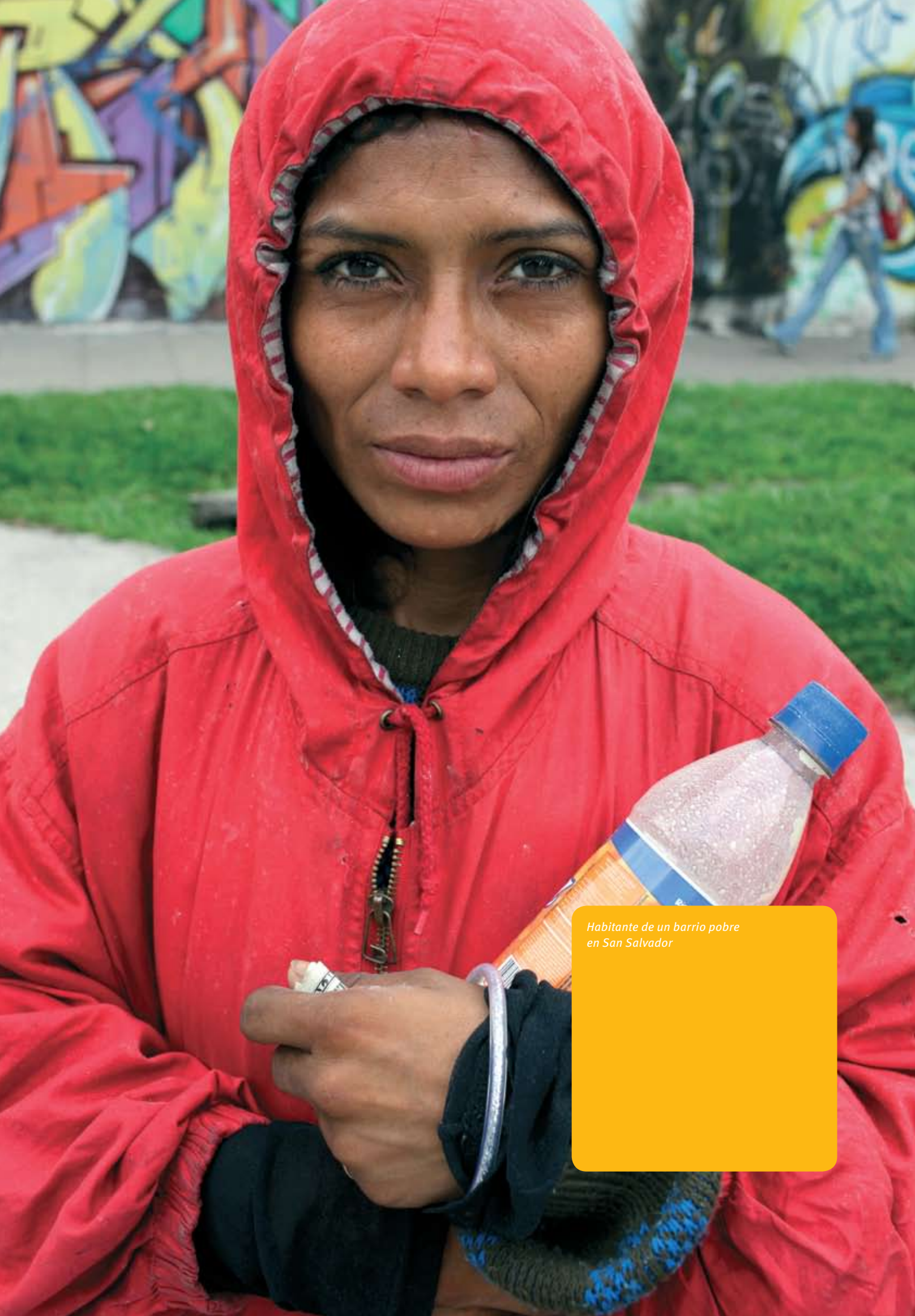
Habitante de un barrio pobre en San Salvador